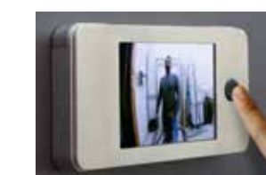
Aufgesetzt für Express

DE-DE - 01/19 Druckfehler, Irrtümer und Technische Änderungen vorbehalten.