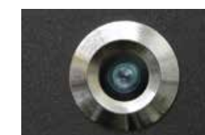
Linse Schutzklasse IP65