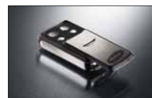
Slider 4-Befehl Handsender